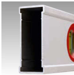
Das neue Power-Profil