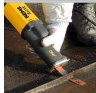
Tested by electrosuisse