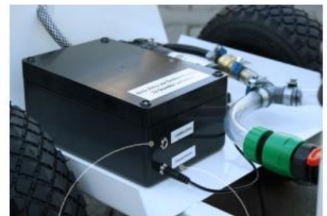
Charging socket Control-current socket

If you follow the above cleaning instructions, the machine will be fully functional and primed for its next use.