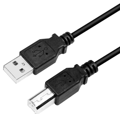
Visuel de référence: Câble USB 2.0, USB A-mâle - USB-B mâle, noir