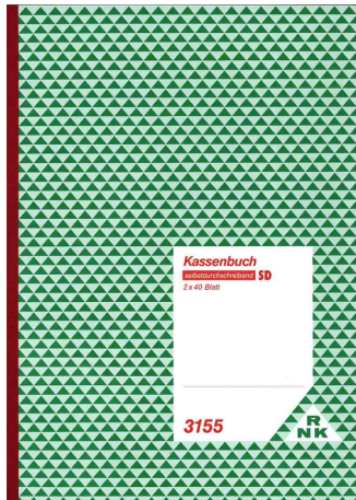
Kassenbuch DIN A4, mit Umsatzsteuererfassung