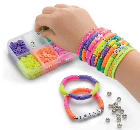
Visuel de référence : présente le résultat final