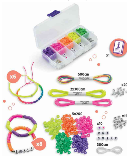
Kit bijoux bracelets NEON IMAGIN'STYLE, contenu