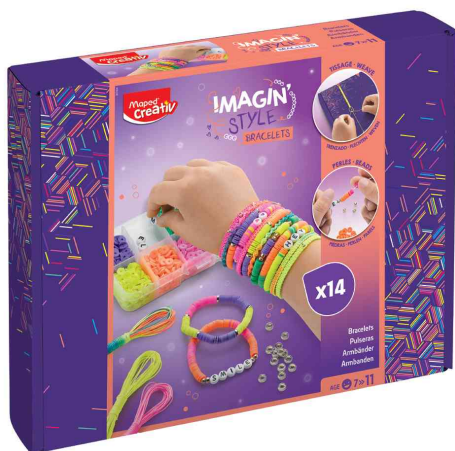
Kit bijoux bracelets NEON IMAGIN'STYLE

ATTENTION ! ne convient pas aux enfants de moins de 36 mois, en raison de petites pièces pouvant être avalées.