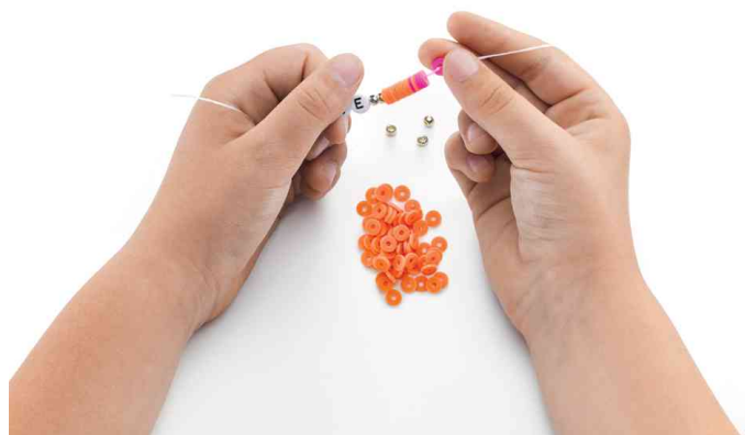
Visuel de référence : présente la technique d'enfilage