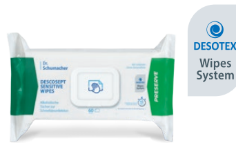
DESCOCEPT SENSITIVE WIPES