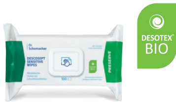
DESCOCEPT SENSITIVE WIPES