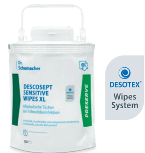
DESCOCEPT SENSITIVE WIPES XL