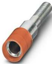
Prüfsteckerbuchse, Farbe: rot

https://www.phoenixcontact.com/de/produkte/0303325