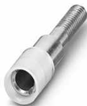
Prüfsteckerbuchse, Farbe: weiß

https://www.phoenixcontact.com/de/produkte/0303312