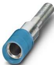
Prüfsteckerbuchse, Farbe: blau

https://www.phoenixcontact.com/de/produkte/0303354