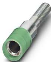
Prüfsteckerbuchse, Farbe: grün

https://www.phoenixcontact.com/de/produkte/0303370