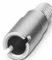
Prüfsteckerbuchse, Farbe: silberfarben

https://www.phoenixcontact.com/de/produkte/0303299