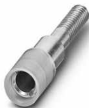
Prüfsteckerbuchse, Farbe: grau

https://www.phoenixcontact.com/de/produkte/0303396