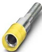
Prüfsteckerbuchse, Farbe: gelb

https://www.phoenixcontact.com/de/produkte/0303367