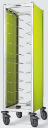
TAW 10 GN mit 2-seitiger Verkleidung, Farbe: limette