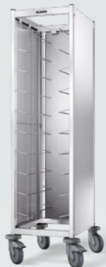
TAW 10 GN mit 3-seitiger Verkleidung, Edelstahl