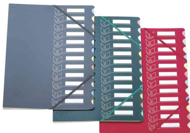
Trieur en polypropylène série 437, 12 touches