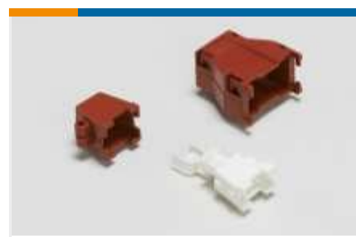
Rechteckige Muffen und Zugentlastung(35)