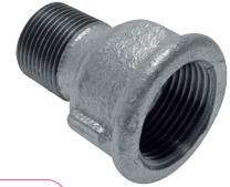
Typ 246/M4 red