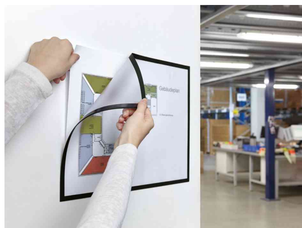
Visuel de référence: exemple d'utilisation