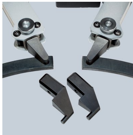
Vervangbare inzetstukken voor binnen- en buitenringen