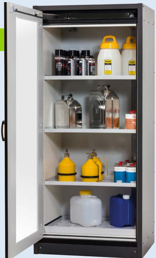
Bild zeigt Schrank mit optionaler Sockelblende