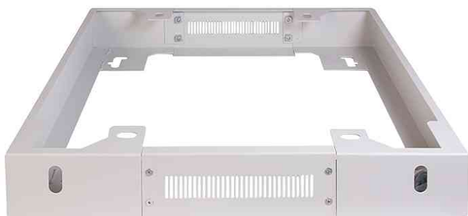
Visuel de référence: Socle pour baies réseaux & serveurs 19", gris clair