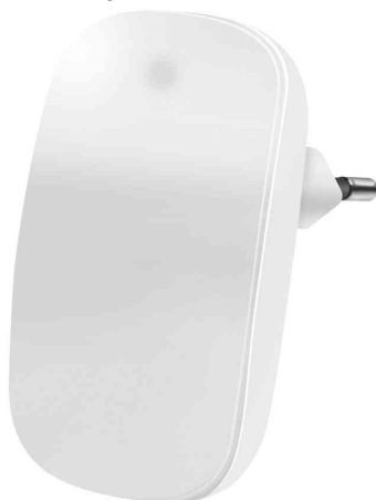
Lampe d'orientation à LED