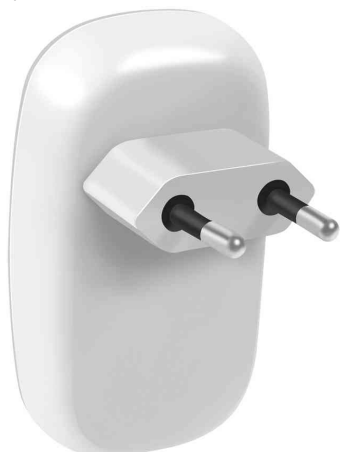
Lampe d'orientation à LED

- parfait pour la chambre à coucher, la chambre d'enfants, la cuisine, la cage d'escaliers ou les couloirs sombres