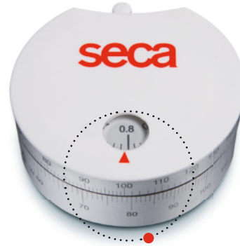
seca 203: Sichtfenster für die Bestimmung der Körperfettverteilung.

metern mehr als großzügig. Das Gehäuse liegt gut in der Hand, fühlt sich angenehm an und ist so robust, dass es auch mal auf den Boden fallen kann, ohne beschädigt zu werden.