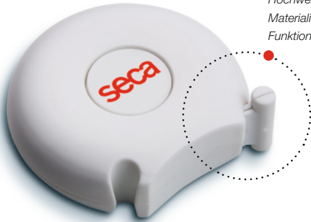
seca 201: Hochwertige Materialien für präzise Funktionalität.