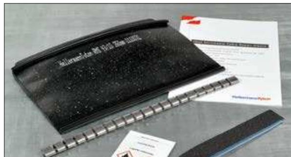
Lieferumfang: Kabelreparaturmanschette, Verschlusschiene, Reinigungstuch, Schmirgelleine, Montageanleitung.