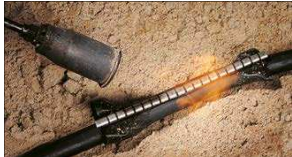
Kabelreparaturmanschetten – für die schnelle und sichere Reparatur vor Ort.