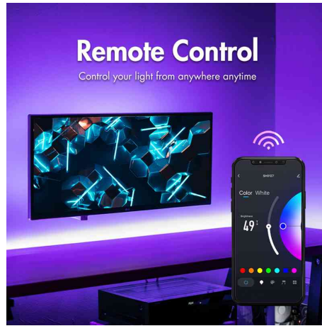
Visuel de référence: présente le produit en utilisation