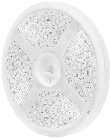
Wi-Fi Smart RGB+W-LED-Band