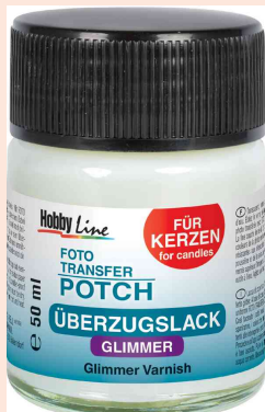
Foto Transfer POTCH Überzugslack für Kerzen