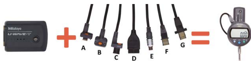
Adó és csatlakozó kábel (lásd következő oldal) pl.: digitális mérőórához