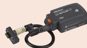
02AZD730G + 02AZD790A U-WAVE-T (Adó) + csatlakozó kábel