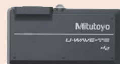
264-620 + 02AZF310 U-WAVE-TC (Adó) + csatlakozó egység