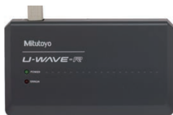
02AZD810D U-WAVE-R (vevő)