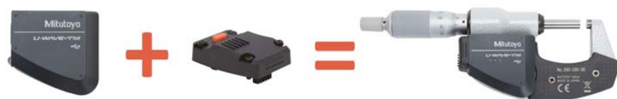
Adó és csatlakozó egység (lásd következő oldal) mikrométerhez (U-WAVE-TM + 02AZF310)