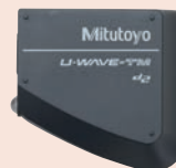
264-622 + 02AZF310 U-WAVE-TM (Adó) + csatlakozó egység