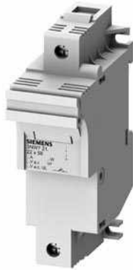
SETRON, Zylindersicherungshalter, 22x58 mm, 1-polig, In: 100 A, Un AC: 690 V, LED Signalmelder