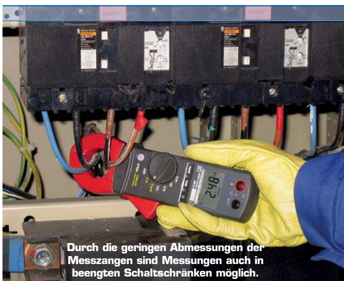
Durch die geringen Abmessungen der Messzangen sind Messungen auch in beengten Schaltschränken möglich.

Für Fachleute der Prüfstellen, der industriellen und gewerblichen Wartung, die mit diesen Schwierigkeiten konfrontiert werden, sind die Messzangen F62/F65 die idealen Werkzeuge. Darüber hinaus gewährleisten diese Geräte auch sämtliche Funktionen einer Vielfachmesszange.