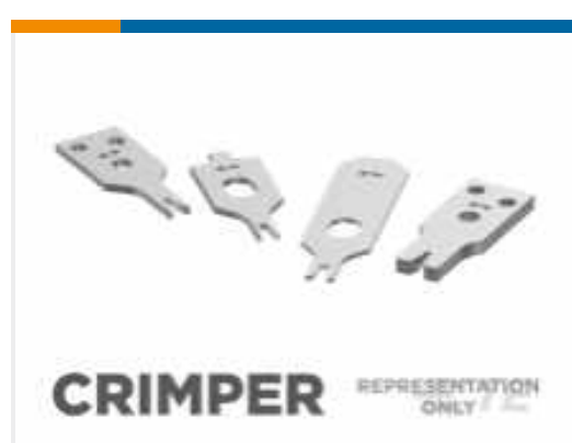
TE Teilenummer656843-3 ISOLATIONS-CRIMPER