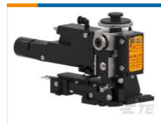
TE Teilenummer2837581-2 OCEAN-2.0-APPLICATOR-SA