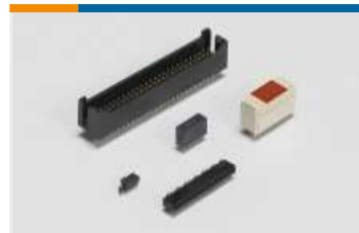
Leiterplatte-an-Leiterplatte-Steckkontakte und -sockel(5291)