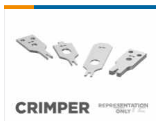
TE Teilenummer7-1633713-9 CRIMPER, WIRE, F PREMIUM