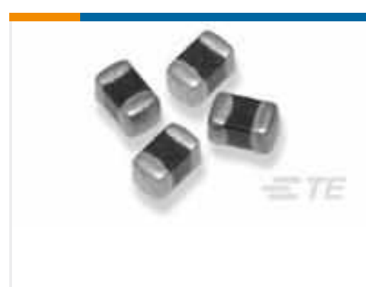
TE Teilenummer1-1624116-2 BMB-B 0603 600R