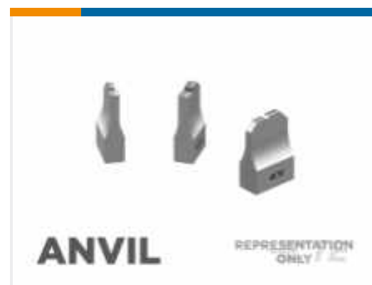
TE Teilenummer2-1803334-2 ANVIL, COMBINATION