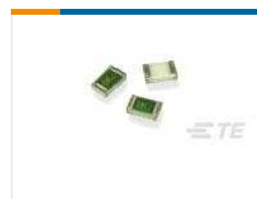
TE Teilenummer1676287-5 RN 0805 2K32 0.1% 10PPM CUT LENGTH