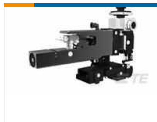
TE Teilenummer2151210-2 OCEAN_2.0_Applicator-S-090F130FA