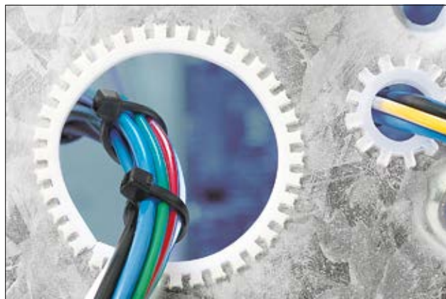
Optimaler Schutz von Kabeln und Leitungen an Blechkanten.