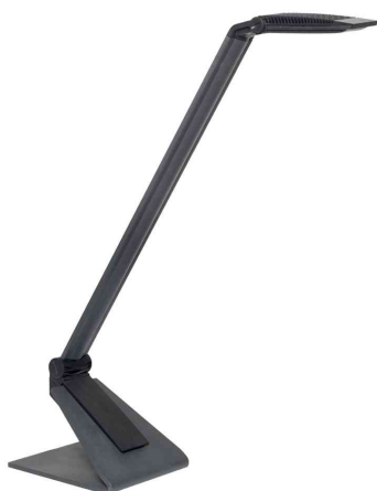
Lampe de bureau design à LED MAULsolaris, anthracite