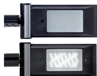
Vue détaillée: intensité lumineuse