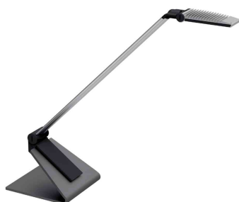
Lampe de bureau design à LED MAULsolaris, argent