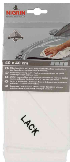
Chiffon en microfibre Performance, pour polissage

EASY-CLEAN LASCHE einfach Hand in die Lasche legen um besser Druck ausüben zu können