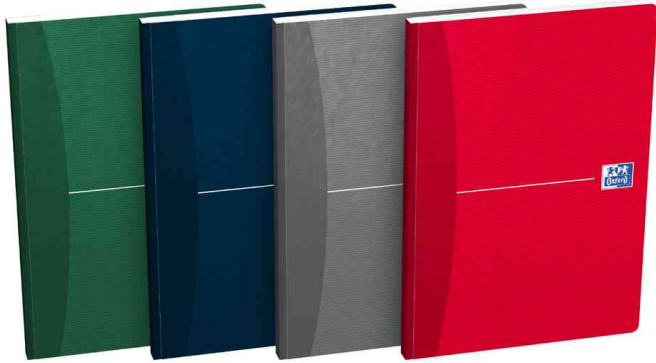
Office Buch "Essentials" - broschiert