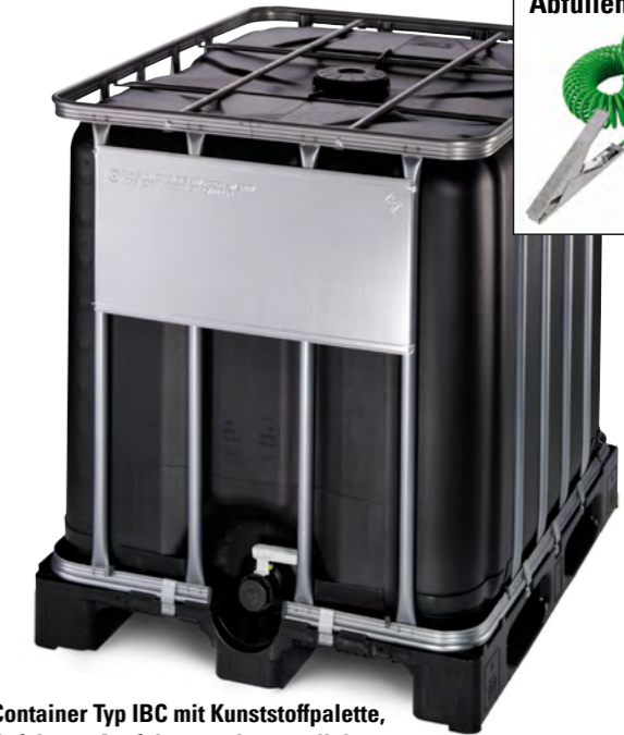
Container Typ IBC mit Kunststoffpalette, Gefahrgut-Ausführung mit zusätzlichem UV-Schutz für den Inhalt, 1000 Liter Volumen, Bestell-Nr. 217-282-62