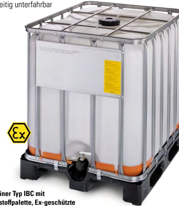
Container Typ IBC mit Kunststoffpalette, Ex-geschützte Gefahrgut-Ausführung, 1000 Liter Volumen, Bestell-Nr. 157-476-62