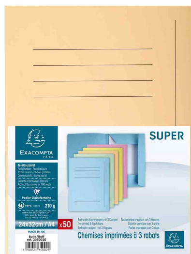
Visuel de référence: Chemise imprimée, emballage