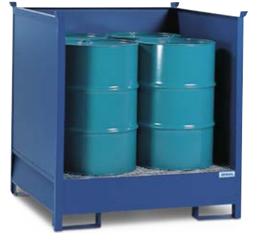
Gefahrstoffdepot 4 P2-O-V50, für 4 Fässer à 200 Liter