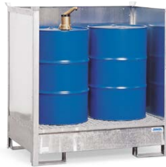
Gefahrstoffdepot 2 P2-O, verzinkt, für 2 Fässer à 200 Liter