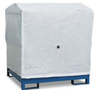
Abdeckhaube für 2 P2-O / -R