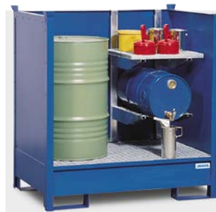
Gefahrstoffdepot 2 P2-O, lackiert, mit Regal für Kleinbinde