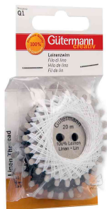
Visuel de référence: présente le produit dans son emballage blister