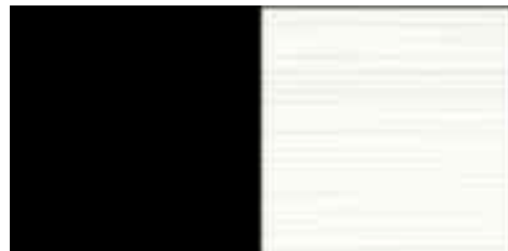
Visuel de référence: fil en étoile, couleur : 9960