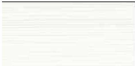
Visuel de référence: fil en étoile, couleur : 5129

- pour coudre les sacs et les sacs à dos