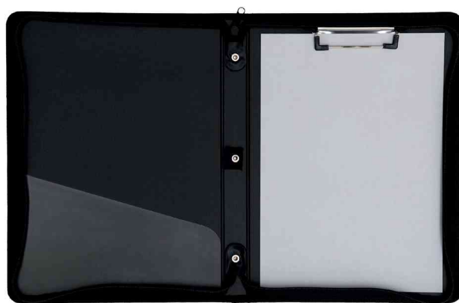
Visuel de référence: vue intérieure (livré sans bloc)