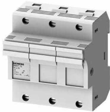
SETRON, Zylindersicherungshalter, 14x51 mm, 3-polig, In: 50 A, Un AC: 690 V, LED Signalmelder