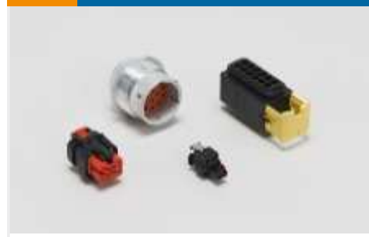
Gehäuse für Kraftfahrzeuge(219)