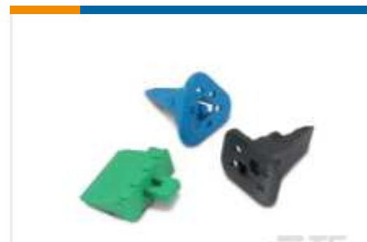
TE Teilnr.:W2S DEUTSCH DT Keilschlösser