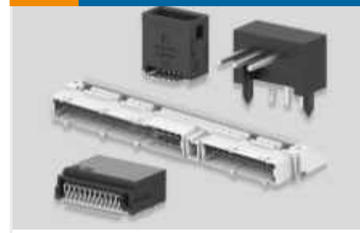
Leiterplattenstiftleisten und -buchsen (78)