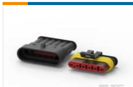
TE Teilnr.:282104-1 AMP SUPERSEAL 1.5MM, STECKVERBINDERGEHÄUSE