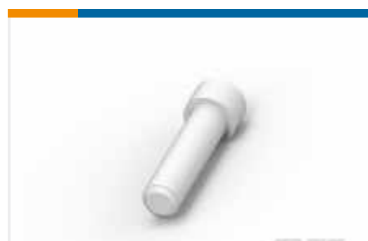
TE Teilnr.:114017-ZZ SEALING PLUG, SIZE 12/16, WHT