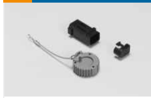
Kappen und Abdeckungen für Automobil-Steckverbinder(11)