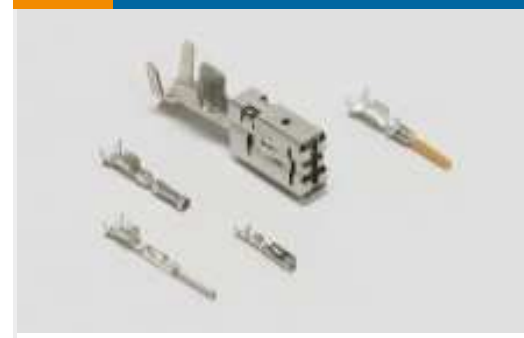
Kontakte für Kraftfahrzeuge(130)