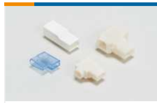
Gehäuse für Crimpkontakte(13)