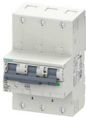
Hauptleitungsschutzschalter (SHU), 3-polig, E 50, 400V