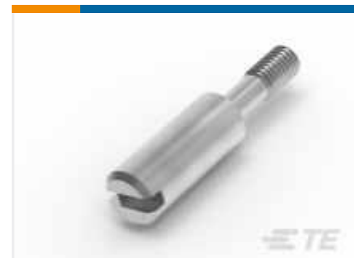
TE Teilnr.:T0931003003-000 CODING-PIN-M3