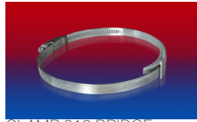
CLAMP 210 BRIDGE CLAMP