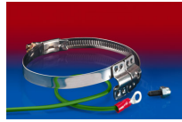
CLAMP 212 EC