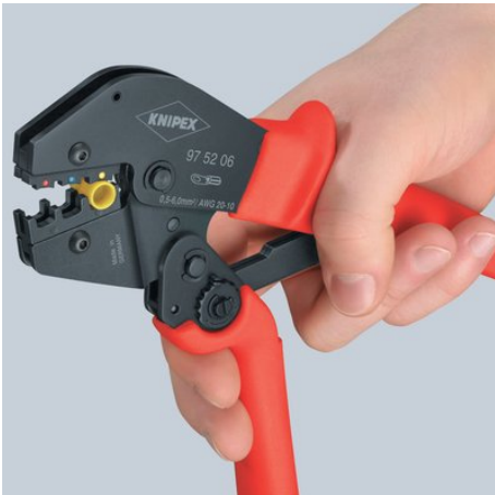
Erster Schritt: Heranholen des Schenkels mit zwei Fingern, bis beide Backen auf dem zu vercrimpenden Verbinder aufliegen