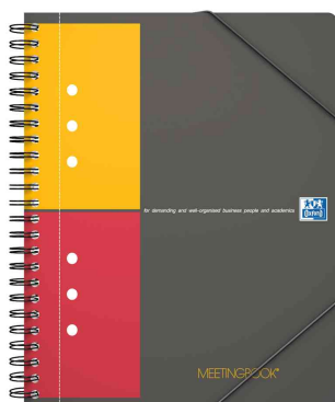
Collegeblock "MEETINGBOOK", DIN A5+, kariert