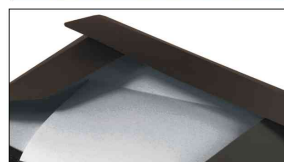
Seitenklappe - Mappe und Collegeblock in einem