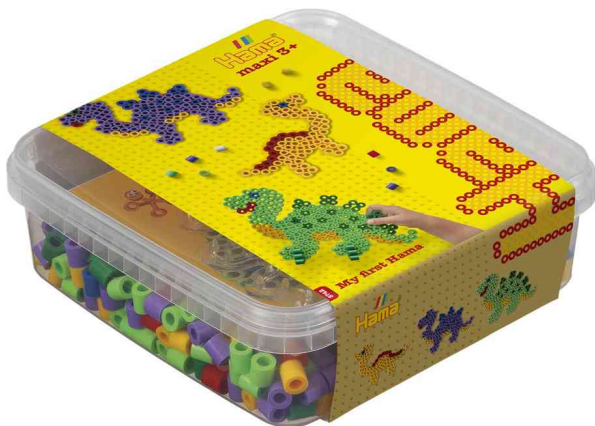
Bügelperlen maxi + Stiftplatte "Dinosaurier", in Box

ACHTUNG! Nicht geeignet für Kinder unter 36 Monaten, wegen verschluckbarer Kleinteile.