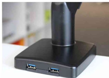
Vue détaillée: Port USB