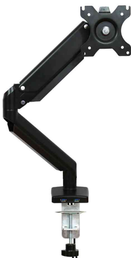
Bras support pour écrans TFT/LCD ERGO ONE

Le bras support pour écrans ERGO ONE contribue considérablement à la conception d'un poste de travail respectueux de la santé. Pour un confort ergonomique, l'écran doit être réglé à la bonne hauteur.