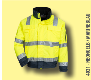
4021 - NEONGELB / MARINEBLAU