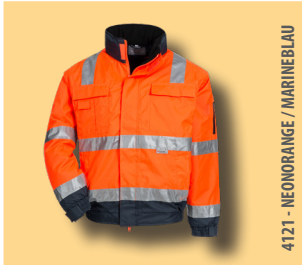
4121 - NEONORANGE / MARINEBLAU