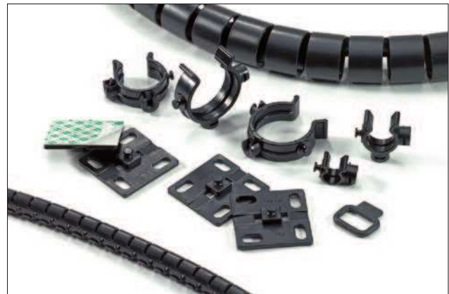
Das Helawrap Zubehör eignet sich zur Bündelung und zum Schutz mehrerer Kabelstränge und Leitungen.