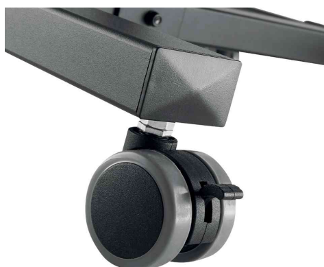
Vue détaillée: roues pivotantes