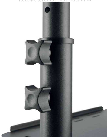
Vue détaillée: molette de serrage