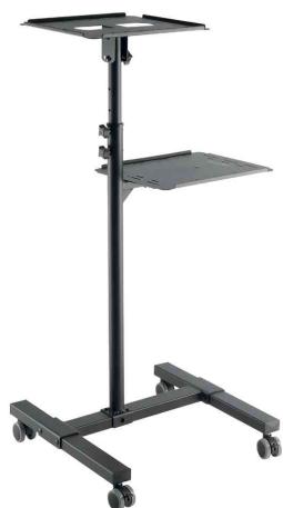
Chariot de projection multimédia en acier, 2 plateaux réglables en hauteur

- adapté pour les centres de conférence, hôtels, salles de réunion et de conseil, salles de formation et showrooms