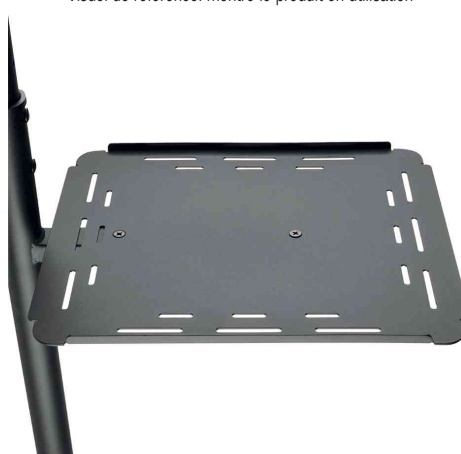
Vue détaillée: surface de travail