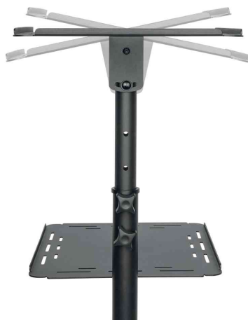
Chariot de projection multimédia en acier, surfaces de travail inclinables