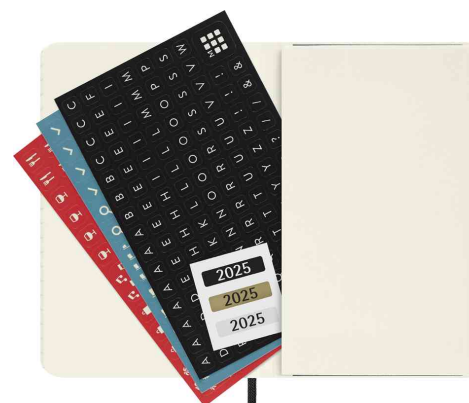
Vue intérieure : stickers dans la pochette intérieure