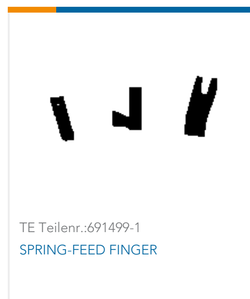
TE Teilnr.: 691499-1 SPRING-FEED FINGER