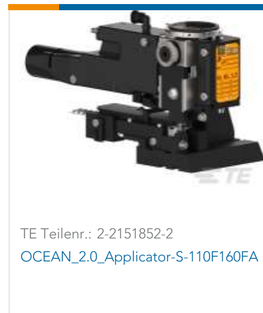
TE Teilnr.: 2-2151852-2 OCEAN_2.0_Applicator-S-110F160FA