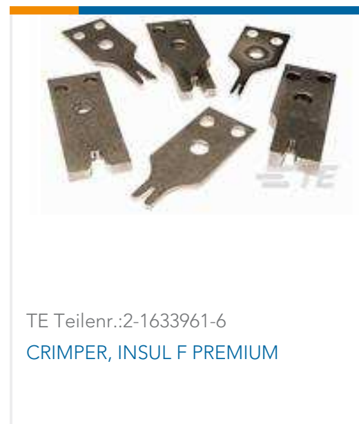
TE Teilnr.: 2-1633961-6 CRIMPER, INSUL F PREMIUM