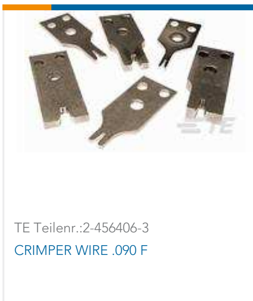
TE Teilnr.: 2-456406-3 CRIMPER WIRE .090 F