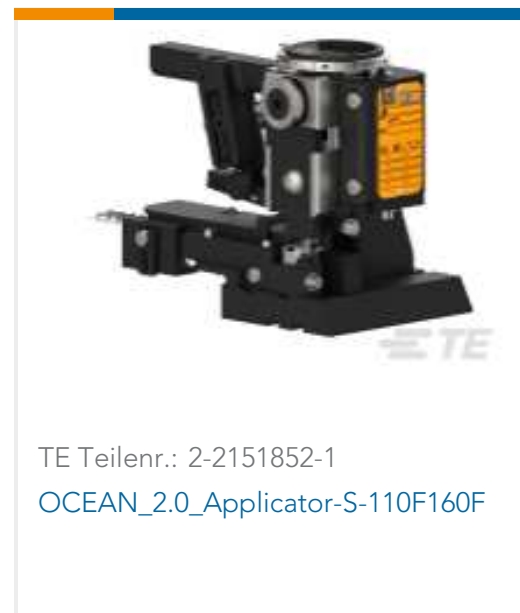
TE Teilnr.: 2-2151852-1 OCEAN_2.0_Applicator-S-110F160F