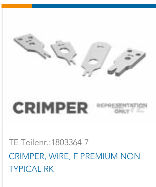
TE Teilnr.: 1803364-7 CRIMPER, WIRE, F PREMIUM NON-TYPICAL RK