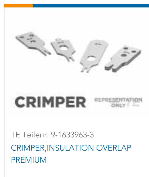
TE Teilnr.: 9-1633963-3 CRIMPER, INSULATION OVERLAP PREMIUM