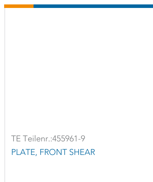
TE Teilnr.: 455961-9 PLATE, FRONT SHEAR