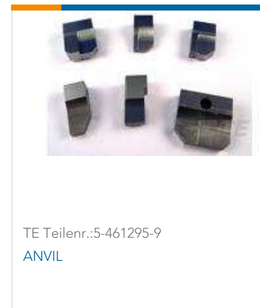
TE Teilnr.: 5-461295-9 ANVIL