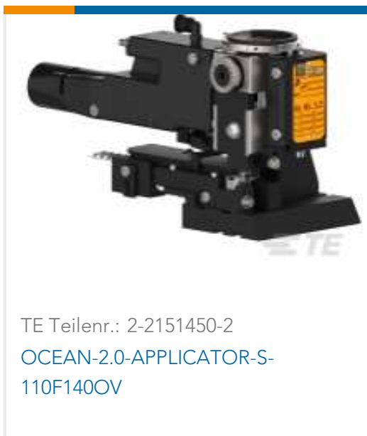
TE Teilnr.: 2-2151450-2 OCEAN-2.0-APPLICATOR-S-110F140OV