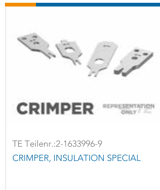
TE Teilnr.: 2-1633996-9 CRIMPER, INSULATION SPECIAL