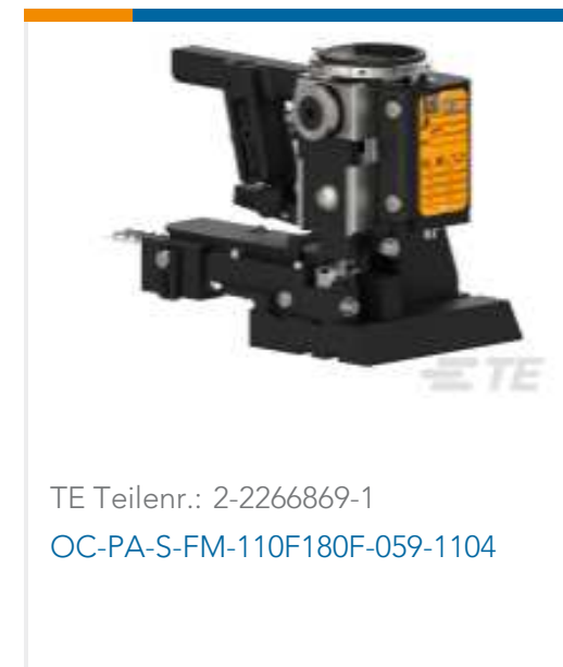
TE Teilnr.: 2-2266869-1 OC-PA-S-FM-110F180F-059-1104