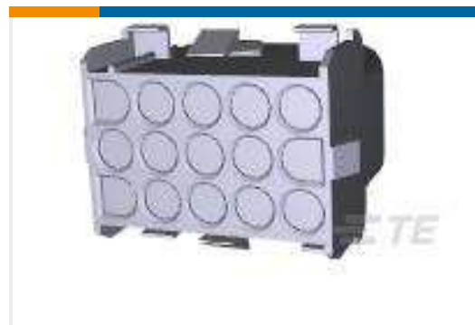
TE Teilnr.:1-480711-9 15P UMNL CAP HSG BLK