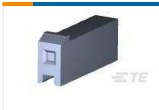
TE Teilnr.:640250-1 01P SL156 HSG W/LCK RAMP NATL