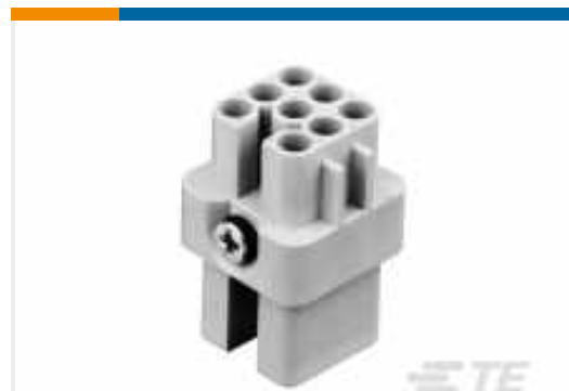
TE Teilnr.:T2020082201-000 HD-008-F