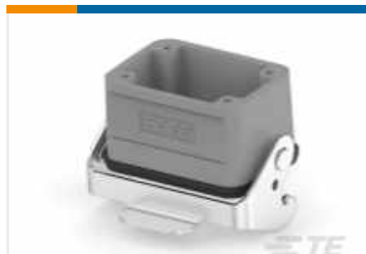
TE Teilnr.:T1730060000-000 H6B-TBF-T