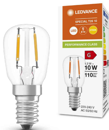
Visuel de référence: Ampoule LED SPECIAL T26, culot E14, transparent